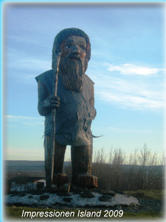
Impressionen Island 2009